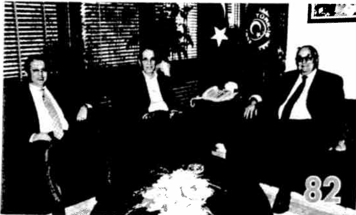
Kudatgobilik Türk- İş Genel Başkanı Atalay'ı Ziyaret Etti