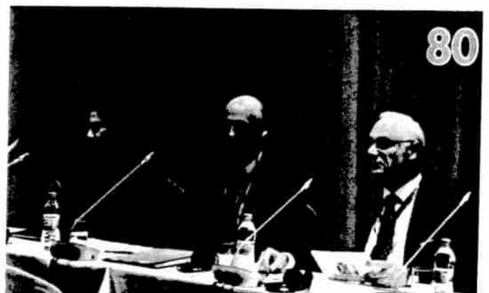
TİSK - ILO İşbirliğiyle Küresel İş Dünyas ve Engelliler Ağı Toplantısı Yapıldı