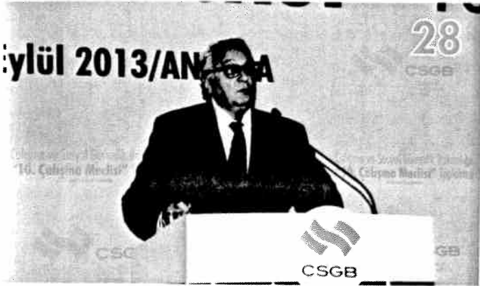
10. Çalışma Meclisi Toplantısı